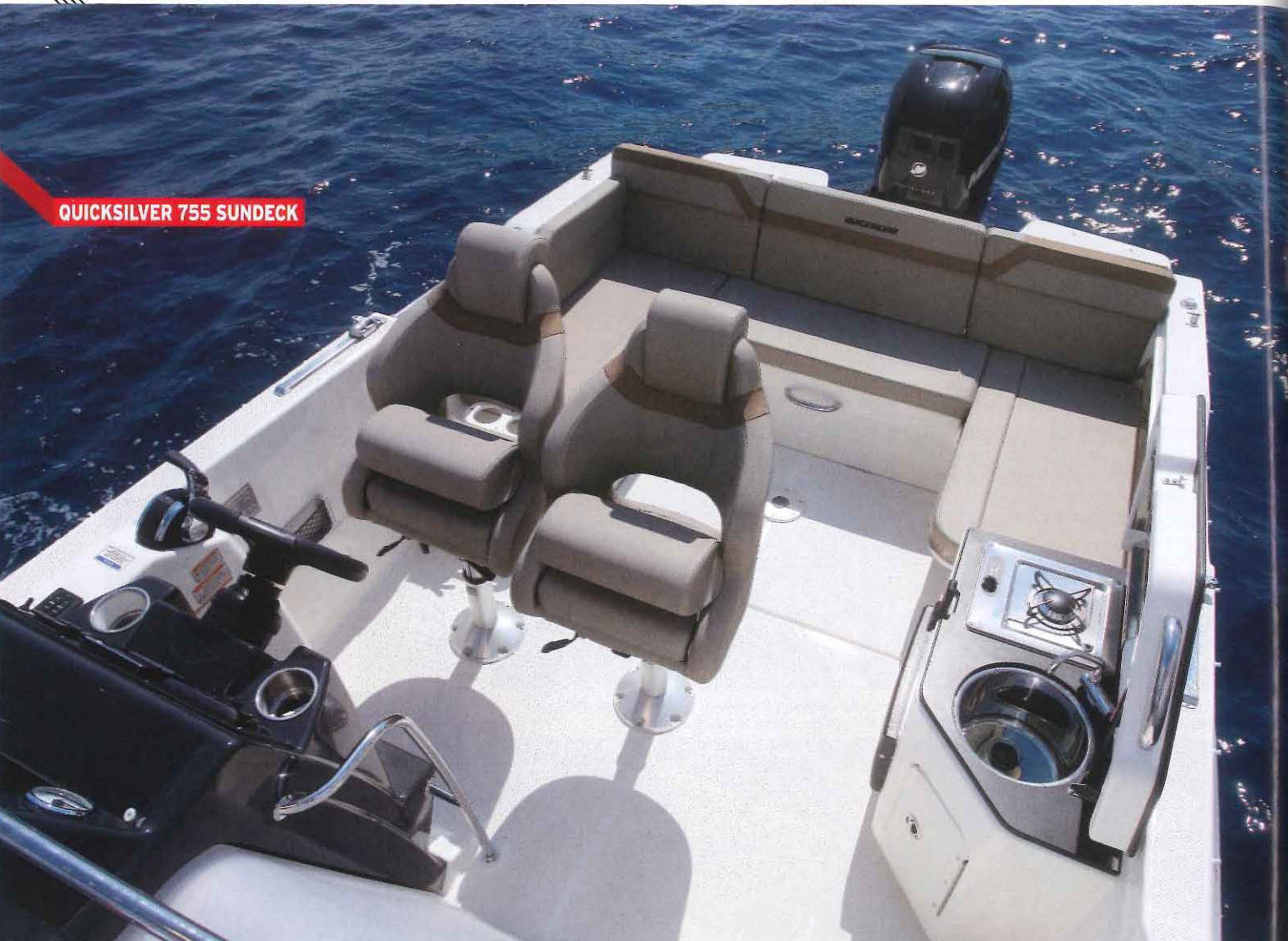
Sur cette vue, la banquette latérale bâbord est déployée (celle de tribord est fixe). Pas moins de 7 personnes peuvent ainsi s'installer dans le cockpit.

dans le cockpit. Non loin d'ici chaque extrémité de la banquette de poupe propose un dossier pivotant faisant office de portillon d'accès aux plages de bain. Voilà qui s'avère bien vu !