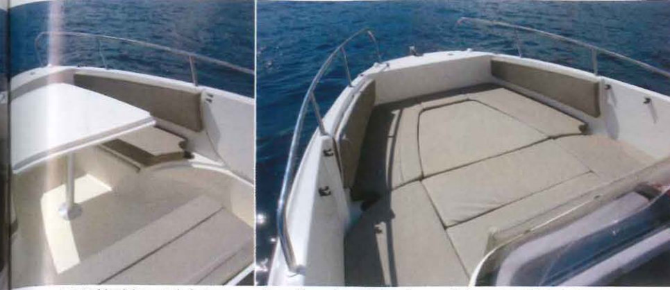
peuvent s'attabler à l'avant du bateau. En configuration solarium la zone de bronzage affiche 1,80 x 1,80 m.