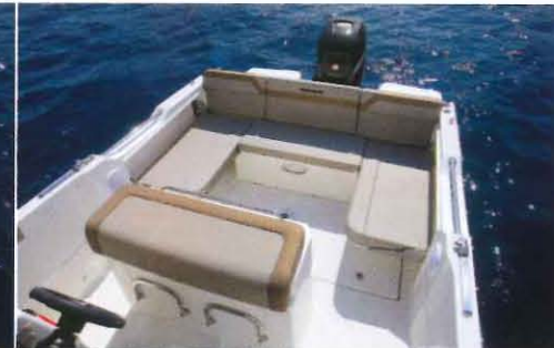
Lorsque les banquettes latérales sont sorties, un salon en U se dévoile pour recevoir jusqu'à 6 convives.