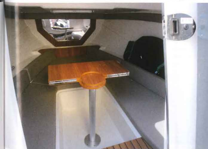
Si la météo se gâte, il sera toujours possible de terminer son déjeuner à l'abri de la cabine grâce à la table en bois pliante et amovible.