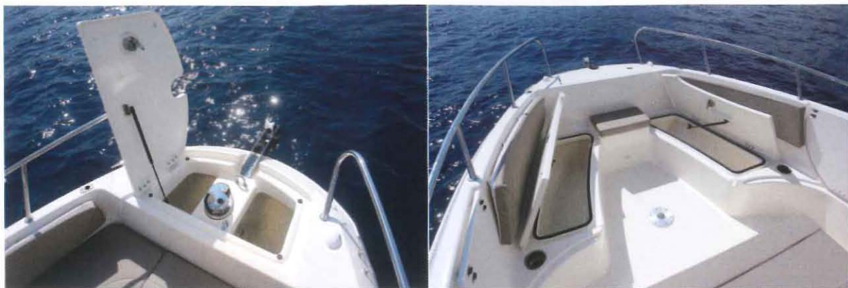
La baille à mouillage dispose d'une grande ouverture assistée par vérin. Chaque banquette du pont avant dissimule un beau coffre de rangement. Jusqu'à 7 personnes