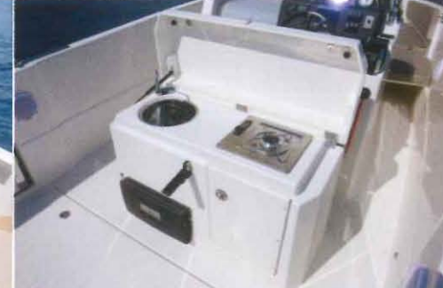
Pour disposer de l'option cuisine d'été il faut choisir le leaning-post en lieu et place des deux sièges individuels.