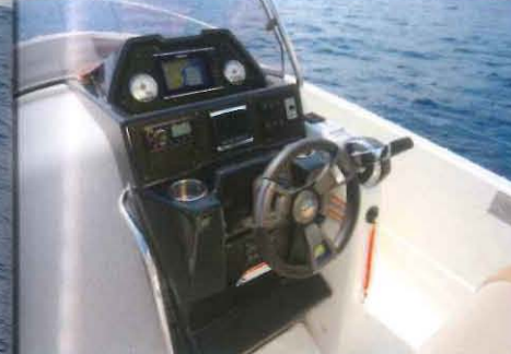
Le poste de barre se révèle assez ergonomique pour le pilote et la lecture des cadrans s'avère sans reproche.