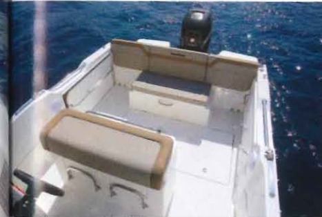
Non déployées les banquettes latérales de pavois dégagent de l'espace de circulation dans le cockpit.