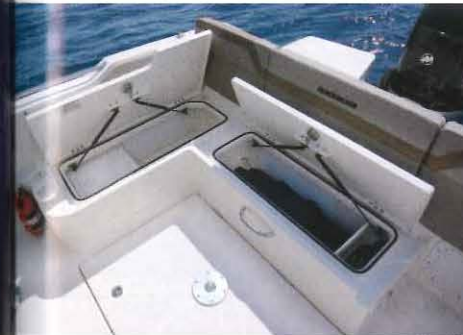
La version Sundeck qui dispose d'une banquette fixe latérale offre donc plus de volume de rangement.