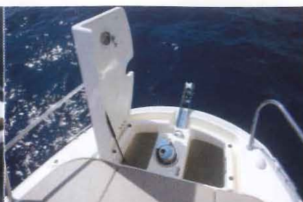
Identique à celle de la version Open, la baille à mouillage s'avère très pratique à utiliser.