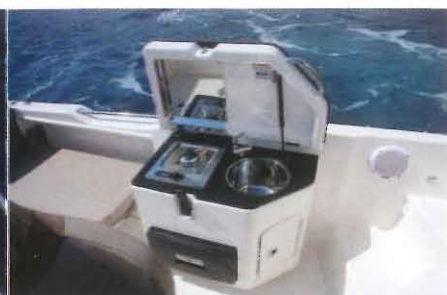
Sur le 755 Sundeck, le bloc cuisine optionnel prend place le long du pavois bâbord. Bien vu !