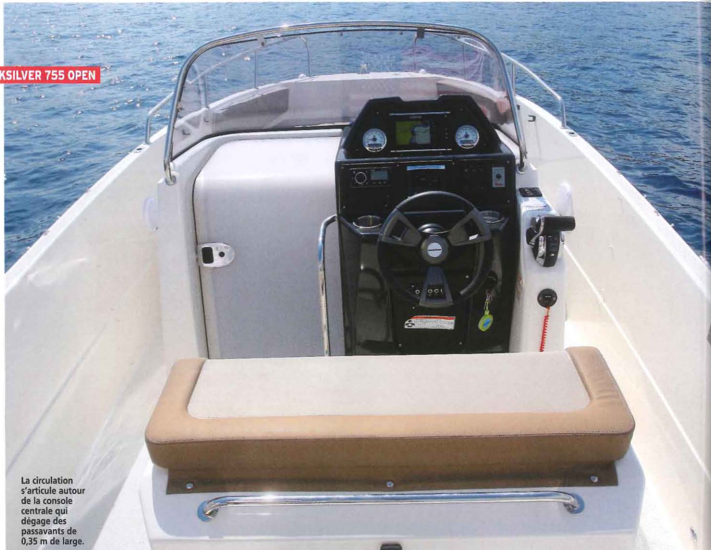
La circulation s'articule autour de la console centrale qui dégage des passavants de 0,35 m de large.