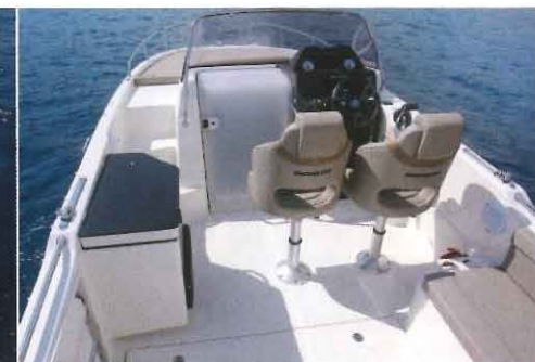
Dans le cockpit, les aménagements laissent suffisamment d'espace disponible pour se déplacer avec aisance.