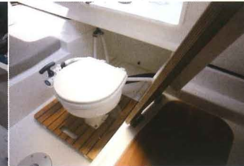
Optionnels, les WC marins sont astucieusement montés sur glissières pour se ranger sous la descente.