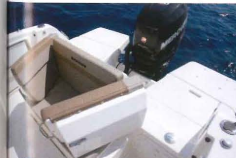
Sur chaque bord le dossier de la banquette de poupe pivote pour dégager l'accès aux plateformes de bain.