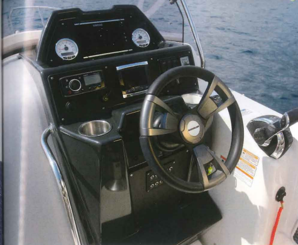
Il s'agit du même poste de pilotage que sur la version Open. Tant mieux, car il s'avère bien conçu à notre goût.

Pour sa part le 755 Sundeck se montre beaucoup plus habitable comme l'exige sa catégorie. En effet, la partie avant pontée du bateau reçoit un immense bain de soleil de 2,00 x 1,80 m agrémenté de dossiers prenant appui sous le pare-brise. Notez d'ailleurs que la partie centrale du solarium s'avère amovible pour dégager le hublot zénithal de la cabine logée en dessous. Enfin comme son jumeau Open, la baille à mouillage se révèle volumineuse puis la grande surface plane qui la recouvre sera sûrement utile pour dé-