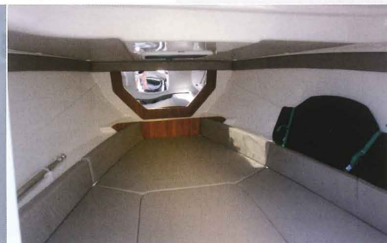
En abaissant la table puis en ajoutant un coussin central, un véritable couchage double de 2,20 x 1,40 m est alors disponible. La hauteur au dessus du lit atteint 0,87 m.