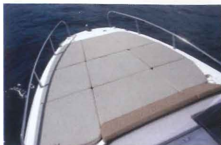
Naturellement un grand bain de soleil occupe l'intégralité du pont avant (2,00 x 1,80 m).