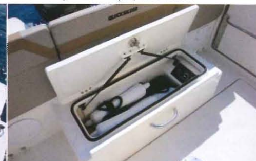
Sous la banquette de poupe, un coffre permet de ranger du matériel. Remarquez le généreux joint d'étanchéité !

Destinés à remplacer les Activ 675 Open et Sundeck, ces nouveaux Activ 755 proposent de nombreuses améliorations. Il est vrai que les bateaux de la gamme Activ du chantier Quicksilver affichent plutôt la réputation de se montrer sécurisants, assez confortables et enfin d'offrir un bon rapport qualité-prix. Côté sécurité, ces deux nouveautés remplissent le contrat en proposant des cockpits protégés par de hauts pavois (de 0,70 à 0,80 m) à l'instar des