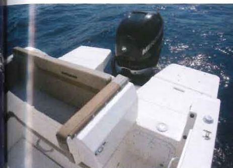
Les 2 extrémités des dossiers de la banquette de poupe pivotent pour faire office de petit portillon.