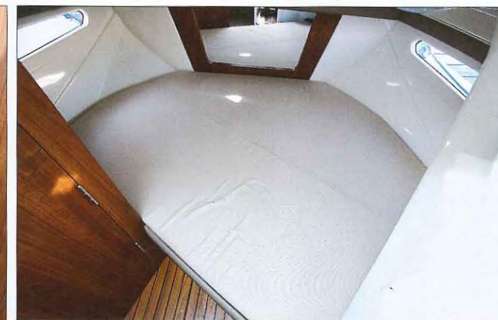
Le couchage double de la cabine avant est placé en biais. Il est assez vaste pour accueillir confortablement deux adultes. Les deux hublots de coque sont très appréciables.