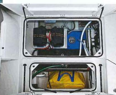
Le plancher du cockpit abrite des grands coffres dont une soute très profonde. Les capots sont assistés par de solides vérins.