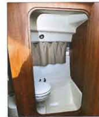
Closed toilet (optional) have neither shower or sink.

The shipyard managed to install a second cabin. This is a little narrow, but it includes a bed for one person (1.88 x 0.90 m).