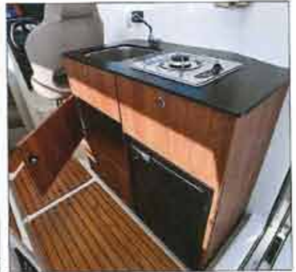
The kitchen presents many closets, but the refrigerator and stove are proposed in option ( € 1,520 ).