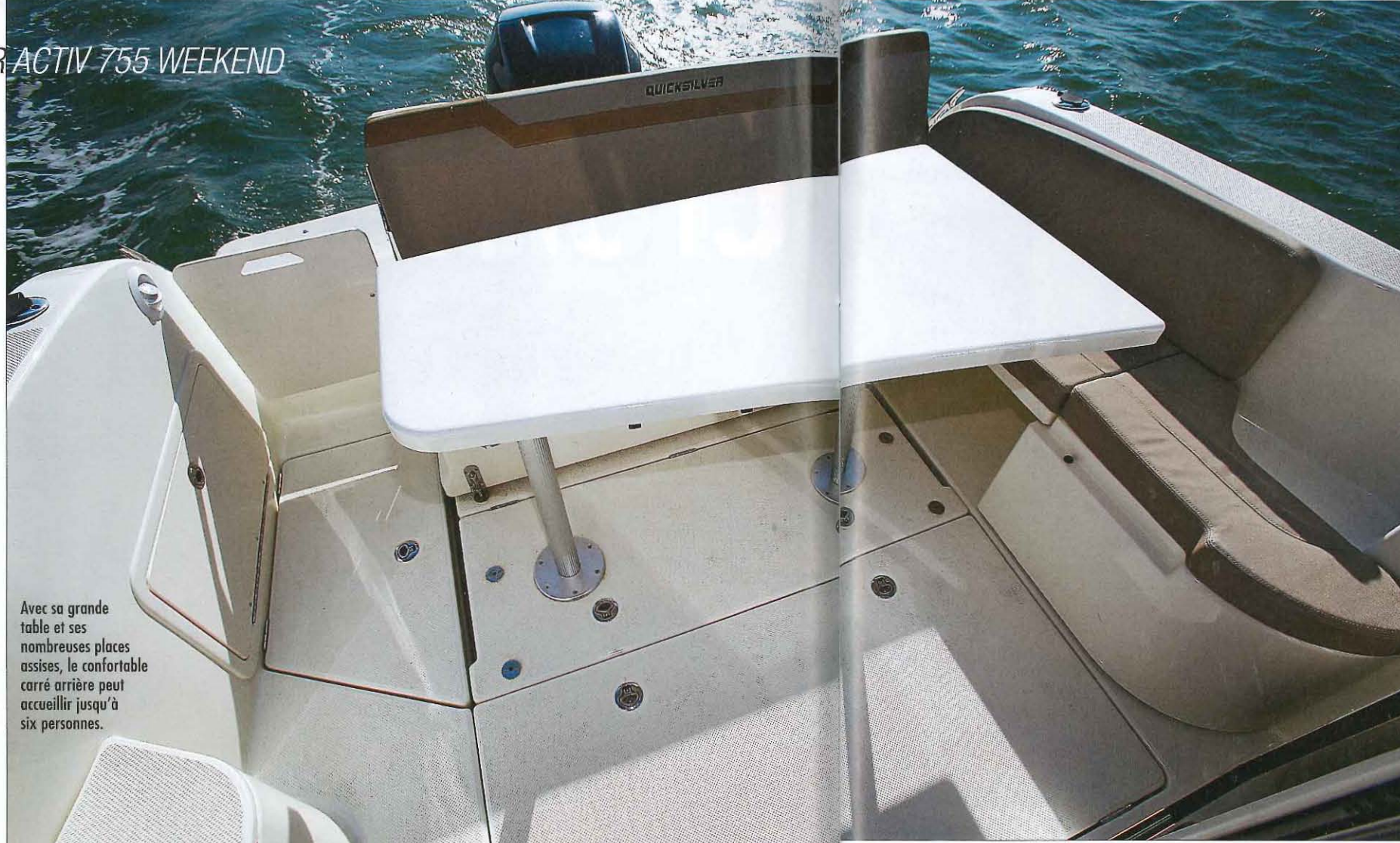
Avec sa grande table et ses nombreuses places assises, le confortable carré arrière peut accueillir jusqu'à six personnes.

Le carré, situé sur bâbord, est modulable en couchage lorsque la table est abaissée; il s'agit cependant d'une couchette d'appoint pour un enfant car elle ne mesure que 1,59 mètre de long. Les deux banquettes en vis-à-vis se montrent très confortables pour deux personnes, mais elles sont un peu étroites pour quatre adultes. La cuisine qui fait face au carré dispose de nombreux rangements très pratiques. Malheureusement, le réfrigérateur et le réchaud à gaz sont en option (1 520 €). Le poste de barre bénéficie d'un tableau de bord très moderne et d'un magnifique volant, mais il manque un vide-poche en hauteur et la commande des gaz est placée trop bas, surtout quand le pilote est debout. Les autres commandes – comme celles des flaps – tombent bien sous les mains et l'emplacement réservé au com-