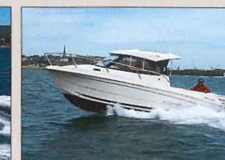
• Bénéteau Antares 780 Prix : 30 500 € sans moteur – Long. : 7,23 m – Larg. : 2,78 m – Mot. maxi : 200 ch – Constr. : Bénéteau (85)