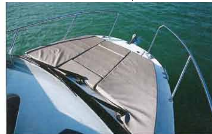
Excellent quality, the upholstery of the large bow sundeck (optional) is attached to the rails, a system that allows good support.