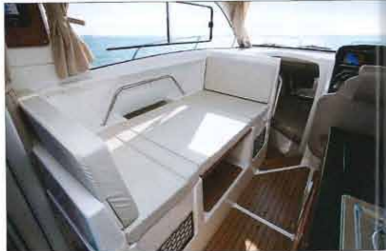
The cockpit floor is home to large chests with a deep bunker . The covers are supported by solid cylinders.