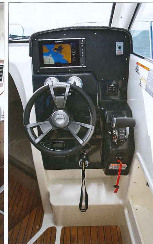
Le tableau de bord est moderne et le volant est magnifique. Cependant, la commande des gaz est un peu trop basse et il manque un vide-poche à portée de main.