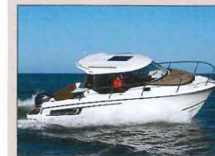
• Jeanneau Merry Fisher 795 Prix : 34 500 € sans moteur – Long. : 7,43 m – Larg. : 2,81 m – Mot. maxi : 200 ch – Constr. : Jeanneau (85)