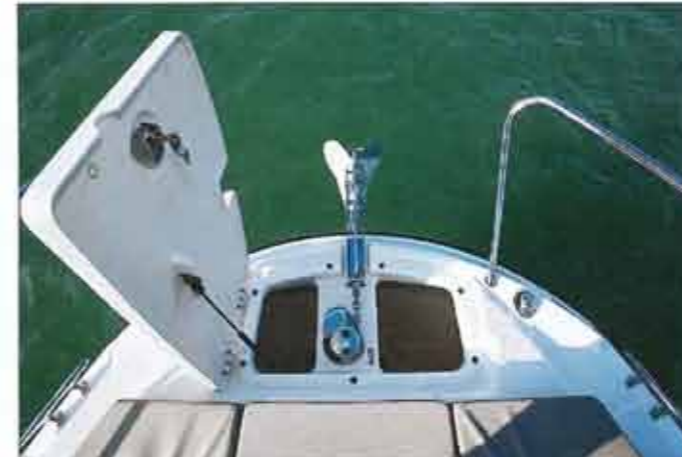
The anchor is a beautiful depth. The electric windlass is optional, but it is in the Smart Edition pack.