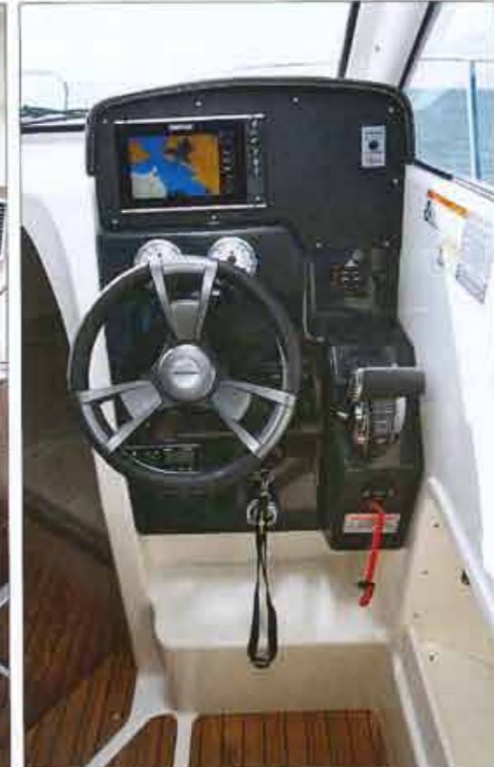
The dashboard is modern and the steering wheel is beautiful. However, the throttle is too low and it lacks a vacuum bag at hand.

The cockpit of the 755 Weekend is quite large (1.28 x 2.22 m) and very flexible. Thanks to the sliding rear seat, it is possible to move forward or backward the seat which optionally features a reclining backrest. A second side seat to port provides a vast square in L. The large removable table, too heavy and not easy to handle, extension serves to convert the Sun square (1.58 x 1.68 m). Two large boxes are accommodated in the cockpit floor, thus increasing the storage volume. Access to bathing beaches is facilitated by a gate on starboard. As for the deckhouse, you take the starboard side deck, wider, but still a little tight. The front is partly occupied by sunbathing whose upholstery is fixed on rails, more practical and better retention than traditional fasteners. As for equipment, the Weekend 755 does not have a very rich standard equipment. The packages offered by the manufacturer is nevertheless interesting, as the Smart Edition which includes all the necessary equipment to comfort and cruising (full kitchen, cockpit saloon, trim tabs, toilet, windlass, sunbathing, shore ...).