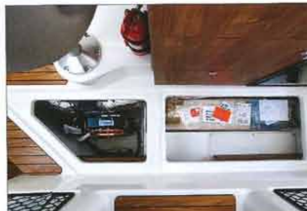
The interior floor has very practical storage compartments. The one on the left houses the air conditioning (optional).

Displayed at a fairly competitive price, finishing with a serious and very cleverly arranged, the new Quicksilver 755 Weekend seems born. This boat which is aimed especially at small cruise shows nevertheless versatile, but its level of somewhat poor standard equipment needed to dip into the options packages offered by the manufacturer.