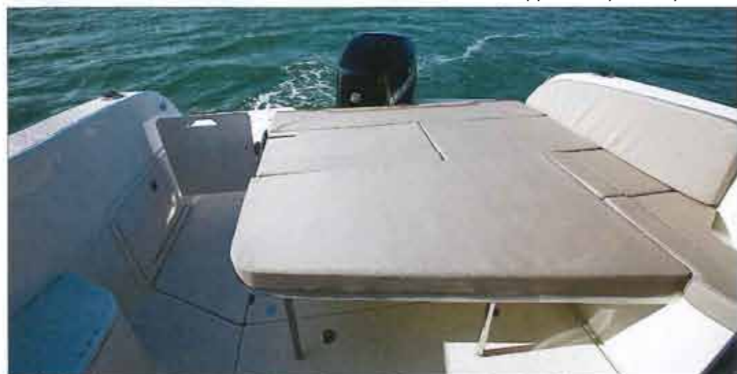
The cockpit table (available as an option only) lowers to form a vast sunbathing (1.58 x 1.68 m).

The cockpit floor is home to large chests with a deep bunker. The covers are supported by solid cylinders.