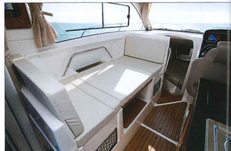
En abaissant la table du carré de la timonerie, on obtient un couchage d'appoint parfait pour un enfant, car il ne mesure que 1,59 mètre de long.