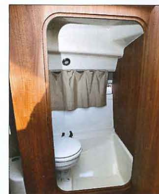
Les WC fermés (en option) ne disposent ni de douchette ni de lavabo.