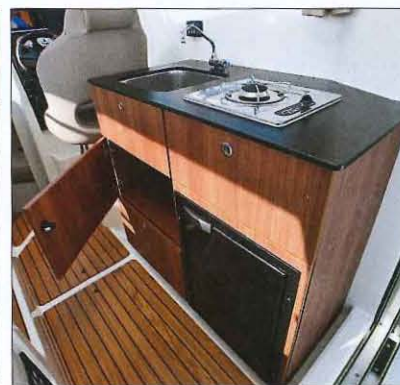
La cuisine présente de nombreux placards, mais le réfrigérateur et le réchaud ne sont proposés qu'en option (1 520 €).