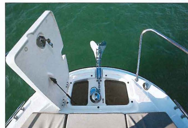
La baigne à mouillage est d'une belle profondeur. Le guindeau électrique est en option, mais il figure dans le pack de l'Édition Smart.