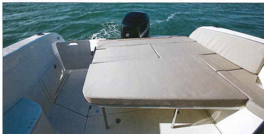
La table du cockpit (proposée uniquement en option) s'abaisse pour former un vaste bain de soleil (1,58 x 1,68 m).