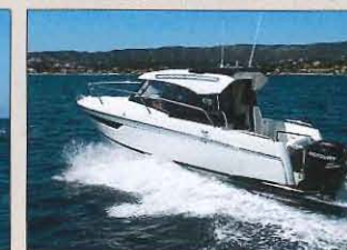
• Parker 750 CC Prix : 38 985 € sans moteur – Long. : 7,46 m – Larg. : 2,50 m – Mot. maxi : 300 ch – Distrib. : réseau