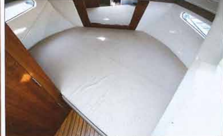
The double bed of the front cabin is placed at an angle. It is large enough to comfortably accommodate two adults. The two hull ports are very significant.