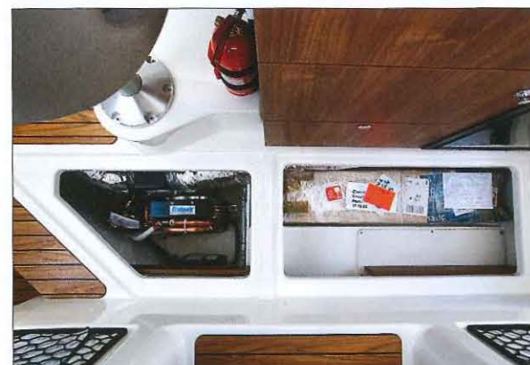
Le plancher intérieur comporte des coffres de rangement très pratiques. Celui situé sur la gauche accueille la climatisation (en option).