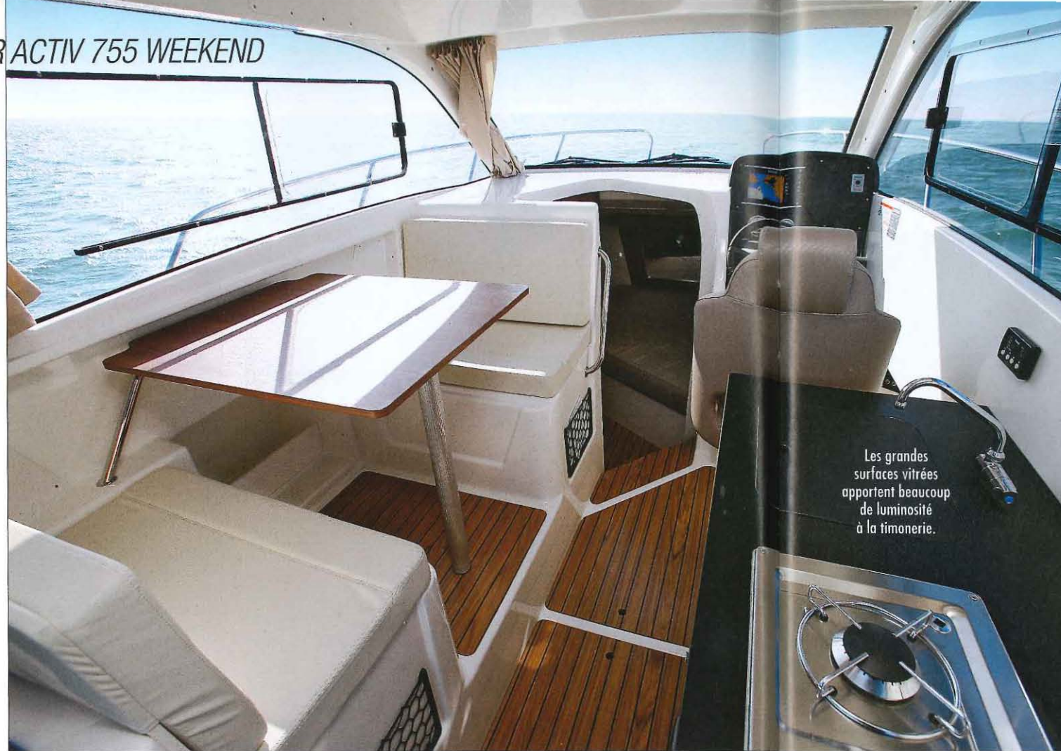
Les grandes surfaces vitrées apportent beaucoup de luminosité à la timonerie.

Affiché à un tarif assez compétitif, doté d'une finition sérieuse et aménagé très intelligemment, le nouveau Quicksilver 755 Weekend semble bien né. Ce bateau qui se destine surtout à la petite croisière se montre malgré tout polyvalent, mais son niveau d'équipement de série un peu pauvre impose de piocher dans les packs d'options proposés par le constructeur.