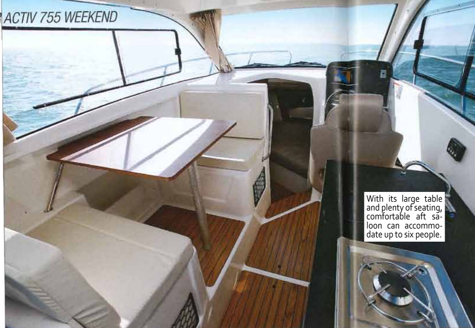
With its large table and plenty of seating, comfortable aft saloon can accommodate up to six people.