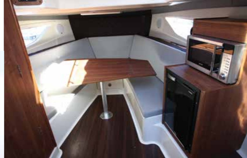
Le salon de pointe de cet habitacle lumineux comprend de hauts dossiers pour le confort. Un grand couchage double de 1,90 x 1,50 m se dévoile en un tournemain pour la nuit.

Volume & modularité dans le cockpit pour un usage familial.