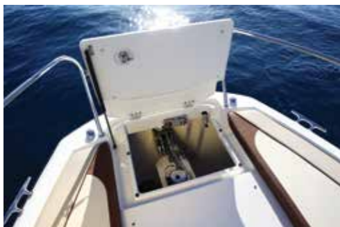
Très fonctionnelle avec sa grande capacité et sa trappe d'ouverture sur vérin, la baille à mouillage se montre pratique.