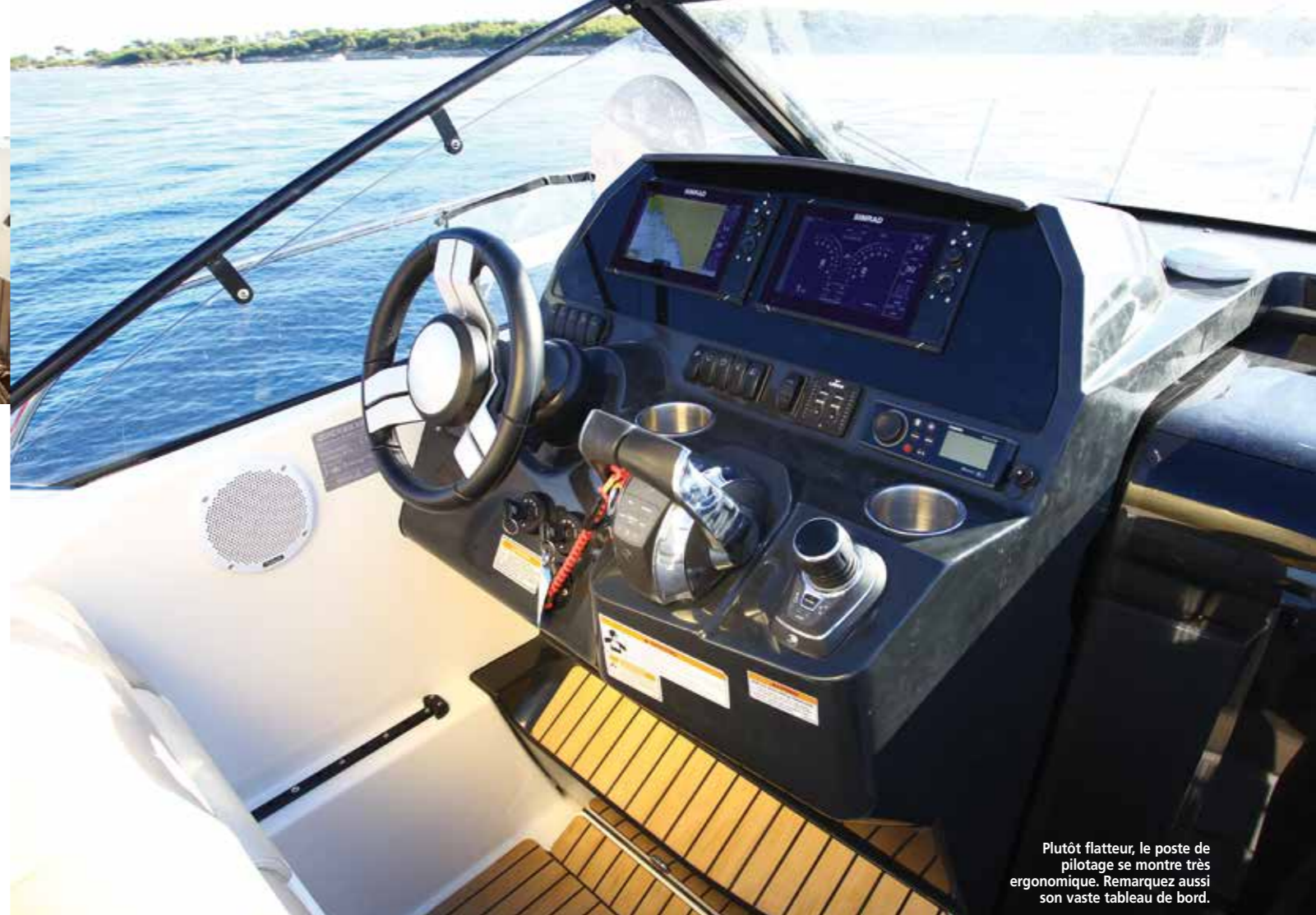
Plutôt flatteur, le poste de pilotage se montre très ergonomique. Remarquez aussi son vaste tableau de bord.

mouillage sera un régal à utiliser en arrivant dans une crique. Sa large ouverture assistée par un vérin à gaz offre un accès facile à la chaîne et la présence du guindeau optionnel monté sur une robuste platine inox ne gêne en rien la manipulation du mouillage. Pour rejoindre le cockpit arrière situé en contrebas, des passavants latéraux ceinturés par de hauts balcons sont à disposition. Le passage tribord affichant 0,39 m de large sera le plus souvent privilégié tandis que celui sur bâbord mesure seulement 0,22 m. Trois marches plus bas, le cockpit du 875 Sundeck se montre des plus accueillants avec ses nombreuses banquettes. La sécurité n'est pas non plus oubliée car les pavois culminent à 0,87 m, les pères de famille peuvent naviguer sereins. Doté d'une