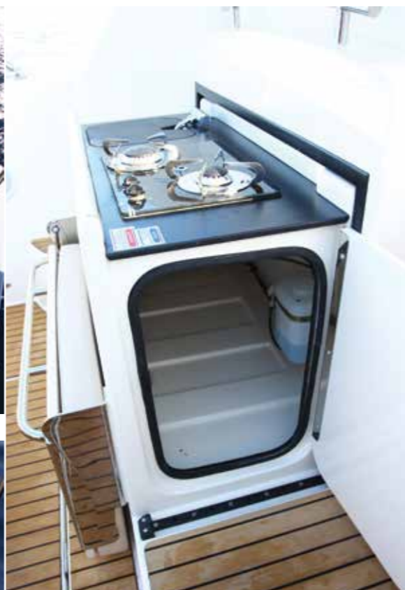
La cuisine de cockpit comprend un grand espace de rangement accessible par le côté. Toujours utile !

banquette en L accolée sur bâbord, le salon peut accueillir jusqu'à 8 convives autour de sa table amovible grâce aux banquettes escamotables optionnelles dont l'une est fixée au pavois tribord et l'autre au dos du pilote. Cette modularité permet également de dégager la circulation si besoin. Enfin comme si la surface de bronzette du pont avant ne suffisait pas il est aussi possible de convertir le cockpit en grand bain de soleil de 1,85 x 1,60 m. Pour cela, il faut abaisser la grande table et basculer complètement le dossier de la banquette de poupe. Autant dire que la manipulation n'est pas sorcière. De surcroît sachez que ce dossier peut aussi s'incliner en position intermédiaire, les amateurs de lecture au farniente seront ravis. Côté rangement, le plancher de cockpit recouvre un immense coffre de cale dont la profondeur atteint 0,80 m. Ouvrir ce rangement permet aussi de découvrir que la trappe présente des supports de fixation pour les pieds de table, la pompe à main ou encore le feu blanc amovible. Pratique ! Des coffres situés sous les banquettes de ce cockpit sont aussi de la partie. A l'heure de l'apéritif, les convives seront heureux