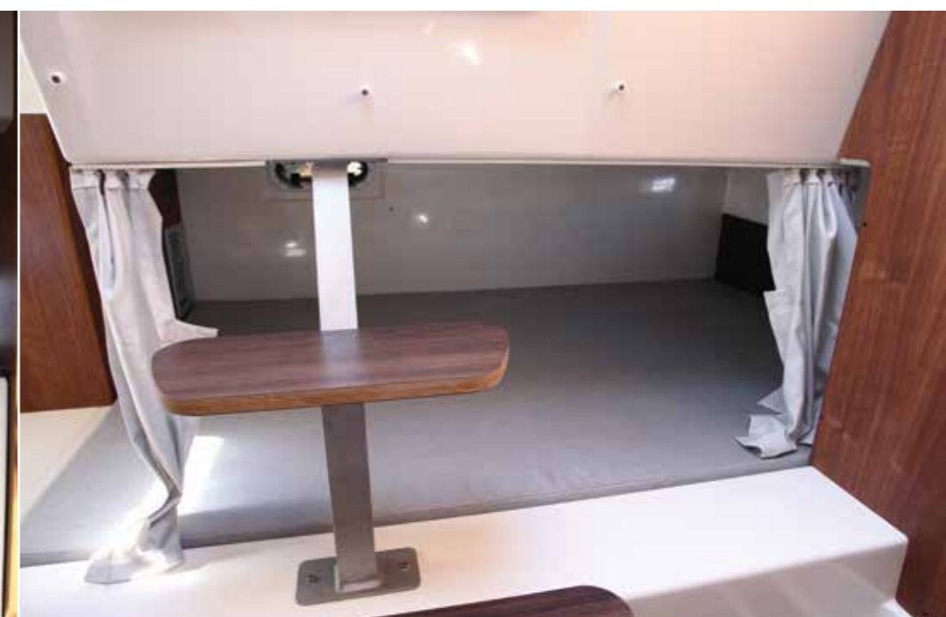
La mid-cabin installée sous le cockpit arrière présente un couchage double (1,95 x 1,30 m) logé en transversal. La hauteur sous plafond s'avère convenable puis des rideaux permettent de profiter d'un peu d'intimité.

de profiter de la belle cuisine extérieure parfaitement dissimulée sous la banquette de pilotage. Du reste pour la découvrir il ne faut pas basculer l'assise pilote comme sur la plupart des bateaux mais simplement la faire coulisser vers l'avant. Effectivement la banquette de pilotage qui recouvre la cuisine s'avère montée sur rails. C'est plutôt malin car de toute manière le poste de pilotage ne sera pas utilisé au moment de préparer le déjeuner. L'optimisation de l'espace est parfaite puis un grand coffre niché sous la cuisine est accessible en latéral. Le plan de travail comprend un évier en standard tandis que les feux à gaz et le réfrigérateur à tiroir de 20 litres sont disponibles en option. Installé sur bâbord, le poste de barre dévoile une superbe planche de bord en gelcoat noir. Suffisamment d'espace s'avère disponible pour intégrer un écran multifonctions de 12 pouces ou alors deux écrans de 9 pouces puis les manettes de gaz tombent parfaitement sous la main. En outre, le joystick de manœuvre équipant le bateau de notre essai profite également de son emplacement dédié. A cela s'ajoute la façade de la stéréo, des rangées d'interrupteurs ainsi que deux porte-verres. Pour sa part le pilote et son copilote jouissent d'une large banquette double avec assises indi-