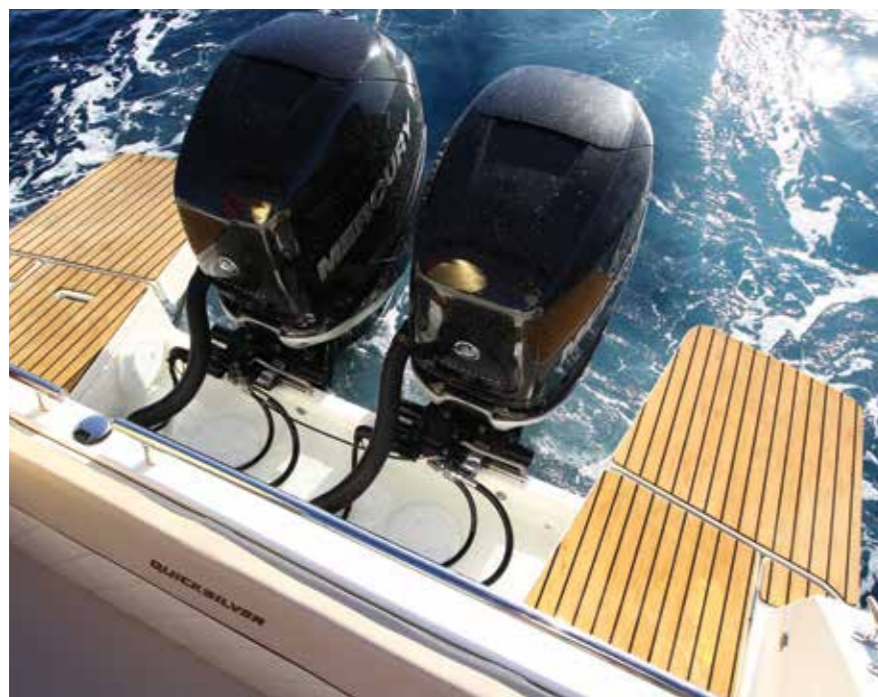
Malgré la double motorisation, les plateformes de poupe avec extension seront appréciées pour la baignade.