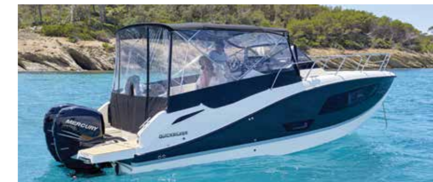
En option, le bimini combiné au taud de camping permet d'abriter le cockpit. Un véritable atout en croisière.

dans le salon de pointe. Capable d'accueillir pas moins de 7 invités autour de sa table amovible celui-ci reçoit de hauts dossiers favorisant le confort. A la nuit tombée cet espace peut aussi se convertir en lit double de 1,90 x 1,50 m. Des équipets ceinturant ce salon puis des coffres logés sous les banquettes sont notamment à notifier. Sur le côté tribord un meuble pouvant recevoir une micro-ondes ainsi qu'un réfrigérateur optionnels permet encore d'agrémenter le confort de ce chaleureux habitacle. Enfin, une mid-cabin située derrière la descente et fermée par un rideau pour davantage d'in-