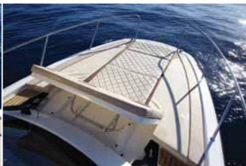
Sur le pont avant le vaste bain de soleil (2,25 x 2,00 m) dispose d'un dossier inclinable suivant 4 positions.