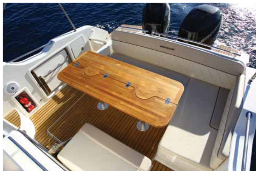
Le salon en L peut accueillir jusqu'à 8 invités autour de sa table grâce à des banquettes escamotables.