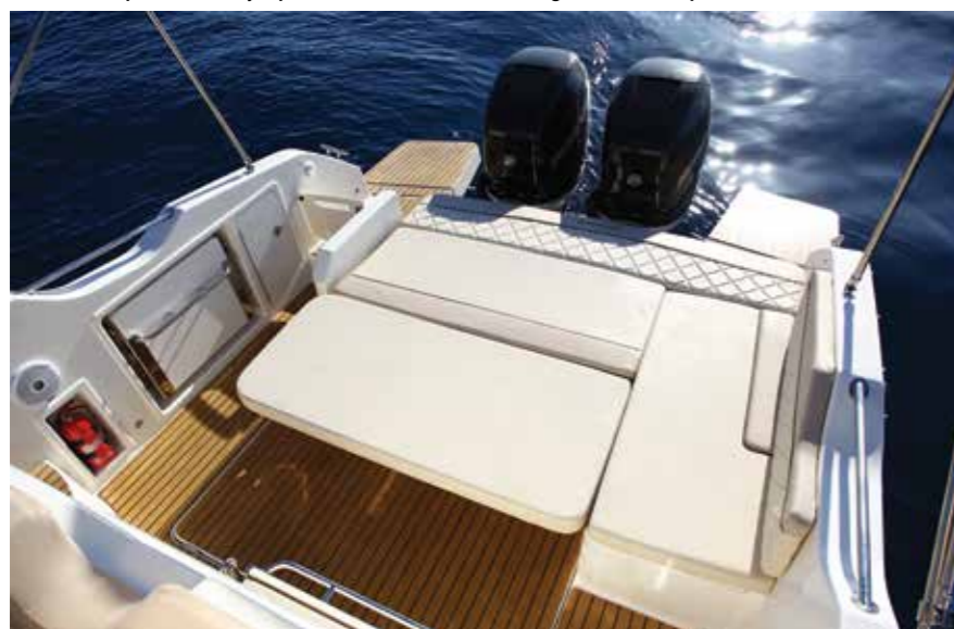
En abaissant la table puis en inclinant le dossier vers la poupe, un vaste bain de soleil (1,85 x 1,60 m) se découvre.