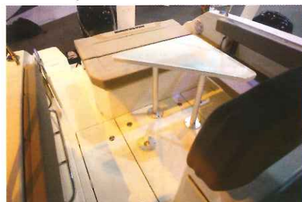
Pour sa part, 5 à 6 invités peuvent s'installer dans le salon arrière qui offre des banquettes escamotables.