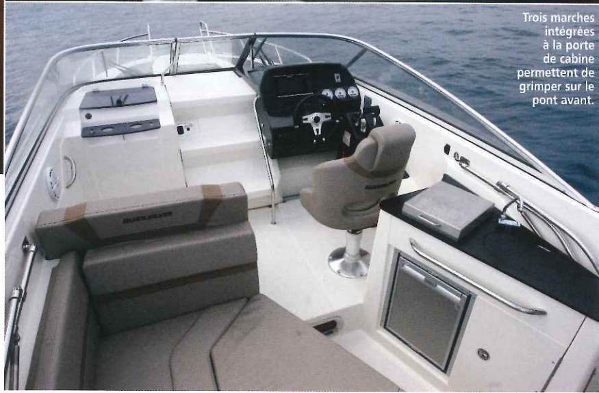
Trois marches intégrées à la porte de cabine permettent de grimper sur le pont avant.

du bateau et les dimensions sont justes dignes de celles d'un palace avec 2,20 x 1,90 m. A cela s'ajoute une mid-cabin fermée par un rideau en arrière de la descente. On y trouve également une belle couchette double (1,90 x 1,40 m), mais située sous le cockpit, la hauteur sous plafond dégage seulement 0,58 m. Pour conclure, une porte à double rabat ouvre sur un cabinet de toilette placé à bâbord. Il comprend le minimum, mais malheureusement pas de placard et sa hauteur sous barrots atteint seulement 1,25 m. ■