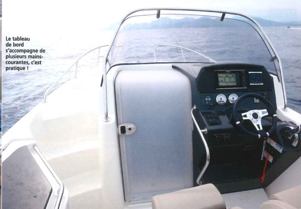
Le tableau de bord s'accompagne de plusieurs mains-courantes, c'est pratique !