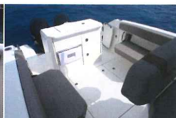
... qui permettent de moduler en un clin d'oeil la configuration du cockpit.