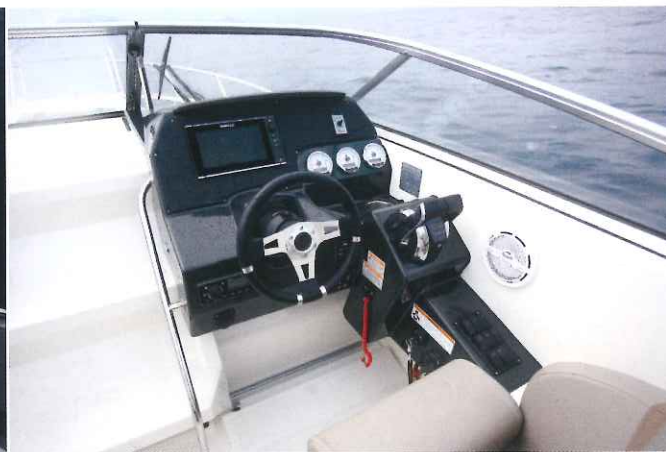
Le poste de pilotage se montre très protecteur et plutôt ergonomique avec des emplacements dédiés pour les manette de gaz et l'électronique.