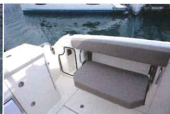
Les hauts pavois de 0,83 m intègrent des banquettes doubles déployables...