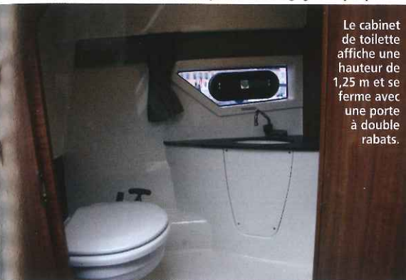
Le cabinet de toilette affiche une hauteur de 1,25 m et se ferme avec une porte à double rabats.