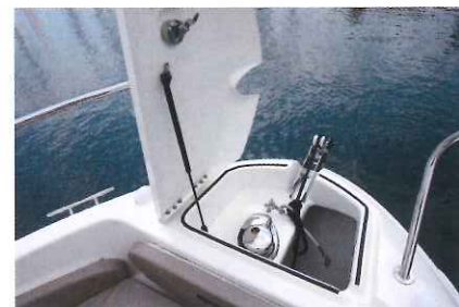
La baïlle à mouillage s'avère très pratique d'accès avec sa grande trappe et son vérin.

ce bateau est vraiment capable d'embarquer tout le matériel adéquat pour la pêche. Ce n'est pas le cas de tous ses concurrents sur le marché. Implantée en position centrale, la console de pilotage est ceinturée par des passavants symétriques (0,36 m) menant à un sympathique salon de pointe. Cinq à six personnes peuvent s'installer confortablement autour de la grande table amovible et chaque extrémité arrière de la banquette est inclinable afin de former une agréable méridienne pour s'allonger face à la route. Voilà un équipement qui séduira de nombreuses personnes. Enfin, bien évidemment, l'ensemble se montre convertible en bain de soleil de 1,70 x 1,50 m. Pendant que certains pêchent dans le cockpit arrière, d'autres pourront ainsi profiter du farniente depuis le pont avant. Pour conclure, passons dans l'habitacle qui se révèle très surprenant pour un open. En effet, alors que nous sommes habitués à découvrir un vaste abri de console sur des bateaux de cette catégorie, l'Activ 805 Pro Fish cache bien son jeu car il renferme non seulement un beau volume de rangement dans la partie avant de la console, ainsi que des wc mais surtout un véritable couchage double (1,90 x 1,40 m) logé sous le cockpit.