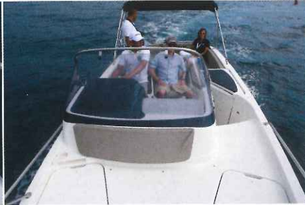
Déporté sur tribord, le poste de pilotage laisse un large passavant avec marches pour l'accès à la pointe.