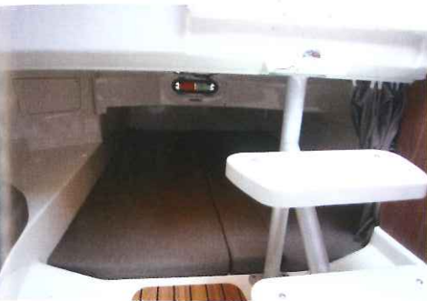
Derrière la descente, la mid-cabin met à disposition un couchage double de 1,90 x 1,40 m.