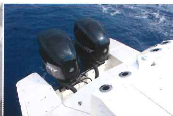
Les plateformes de poupes présentent un double accès depuis le cockpit.