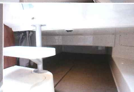
Situé sous le cockpit, le couchage arrière offre des dimensions de 1,90 x 1,40 m et une hauteur de 0,58 m.