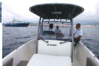
La console centrale dégage des passages symétriques de 0,36 m de large.