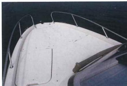
Ici dépourvue de sa sellerie, la surface de bronzage avant (2,00 x 1,70 m) intègre des dossiers inclinables.

1,65 m, ce qui s'avère plutôt correct. En face, un carré en U pour 5 personnes constitue un agréable salon d'intérieur. La clarté ambiante y est convenable grâce aux longs panneaux de coque. Cependant, remarquez qu'il n'y a pas de hublot zénithal comme sur le Cruiser. Enfin, ce salon peut aisément se moduler en couchage double de 1,80 x 1,70 m, voilà qui sera très confortable. Enfin, une salle d'eau, elle aussi identique à celle du Cruiser trouve sa place à tribord. Néanmoins sa hauteur sous barrots de 1,43 m sera d'autant plus appréciable. En dernier lieu, une mid-cabin dont l'intimité sera préservée par un rideau coulissant dévoile un lit double de 1,90 x 1,40 m et une hauteur sous plafond de seulement 0,58 m, car rappelons-le, cet endroit est situé sous le cockpit. ■