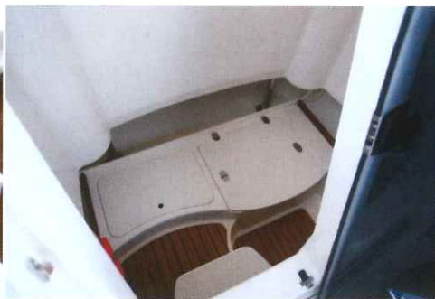
Au pieds de la descente, la hauteur sous barrots atteint 1,62 m et des rangements sont disponibles.