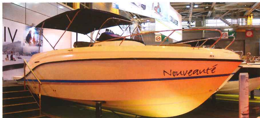
L'Activ 805 Open était notamment à découvrir au Nautic de Paris sur le stand Quicksilver.

ASSURANCE (avec 2 x 200 ch) Avec Prime annuelle : 565,40 € Franchise : 700 €