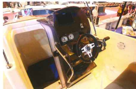
La console présente un superbe poste de pilotage ainsi qu'une porte coulissante menant à la cabine.