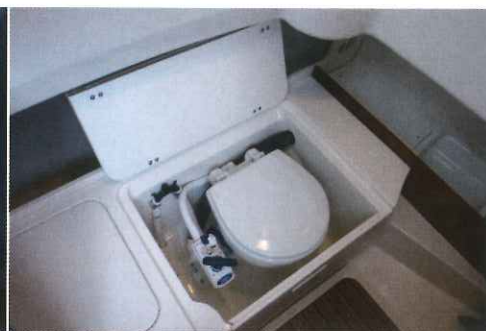
La trappe tribord renferme pour sa part un emplacement pour wc marins, c'est toujours appréciable.