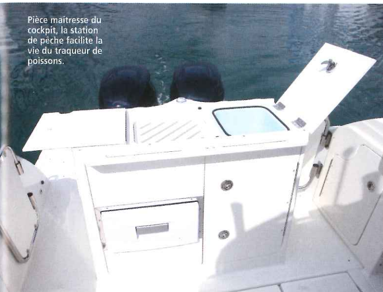
Pièce maîtresse du cockpit, la station de pêche facilite la vie du traqueur de poissons.