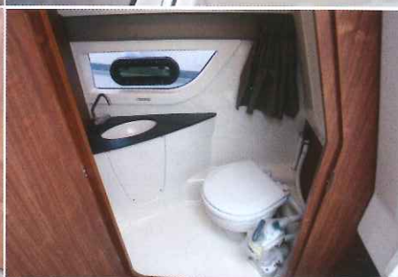
Avec ses 1,43 m de hauteur sous barrots et sa large porte, le cabinet de toilette se montre fonctionnel.