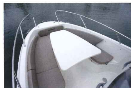
Destiné à recevoir 5 à 6 invités, le salon de pointe se révèle convivial et plutôt sécurisant.