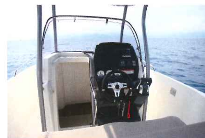
Le poste de pilotage se montre très ergonomique et s'accompagne de plusieurs mains-courantes.

Certes, la hauteur sous plafond s'avère limitée (0,58 m) mais il s'agit d'un véritable lit double avec de dimensions de 1,90 x 1,40 m. Bien joué Quicksilver ! ■