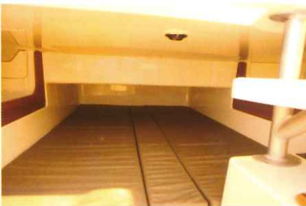
En contrebas, un couchage de 1,90 x 1,40 m et une hauteur de 0,57 m permettent de passer une nuit.