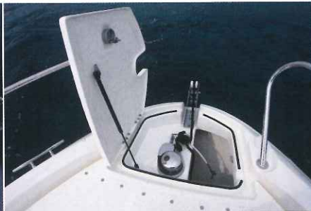
La baille à mouillage dispose d'une belle trappe d'ouverture montée sur vérin, c'est pratique !