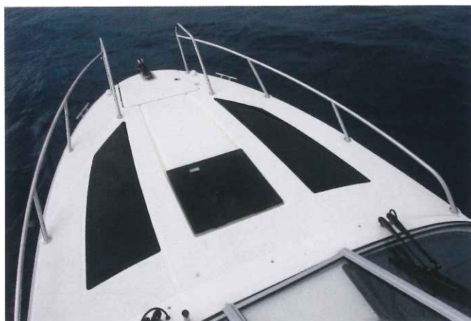
Le pont avant de l'Activ 805 Cruiser se voit bien ceinturé par des balcons et présente de belles surfaces vitrées qui apportent de la clarté dans la cabine.

même d'une assise relevable. Enfin, pour grimper sur le pont avant, il faut emprunter trois grandes marches moulées à la porte de cabine coulissante. Après avoir traversé le pare-brise qui s'ouvre par le milieu, on débouche sur un pont doté de belles surfaces vitrées, attention donc à ne pas glisser pour rejoindre la grande baïlle à mouillage. En contrebas, le navire renferme un habitacle chaleureux avec une hauteur sous barrots de 1,45 m à l'entrée. La luminosité est bonne grâce aux hublots placés sur le pont avant et aux longs panneaux de coque. Installé en biais, un lit double occupe la pointe