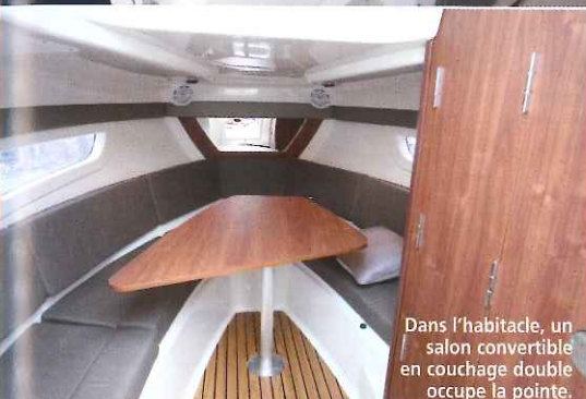
Dans l'habitacle, un salon convertible en couchage double occupe la pointe.