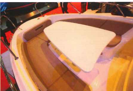
Le salon de pointe sera idéal pour partager un apéritif à 6 personnes grâce à sa banquette en V.