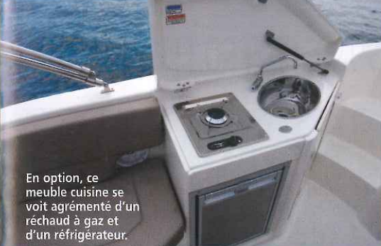
En option, ce meuble cuisine se voit agrémenté d'un réchaud à gaz et d'un réfrigérateur.