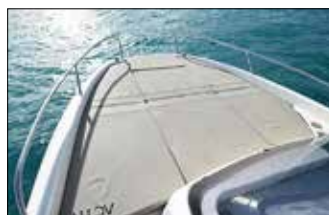
C'est un sacré bain de soleil à l'avant, il mesure 1,87 par 1,76 m à la base.