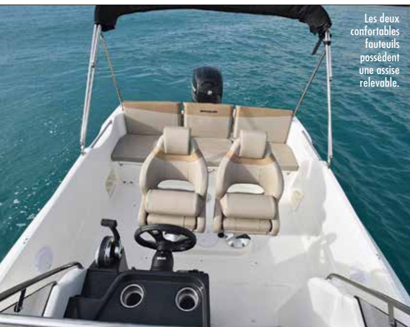
Les deux confortables fauteuils possèdent une assise relevable.

L'existence d'un plan de pont open et sun-deck sur ces deux coques de respectivement 5,75 et 6,45 mètres a toute sa raison d'être selon sa préférence envers un cockpit entièrement protégé pour la sécurité des enfants et pour la pêche (version Open), ou un grand bain de soleil avant à poste et une cabine assez spacieuse pouvant être assortie de WC chimiques (version Sundeck). ■