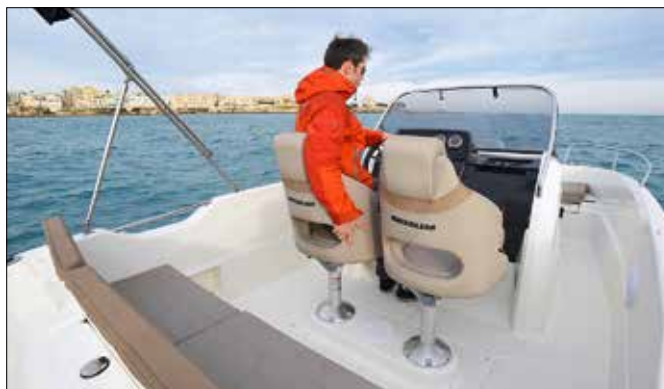
Les sièges de cockpit sont désormais montés sur un socle en polyester renforcé pour limiter les oscillations et les vibrations.