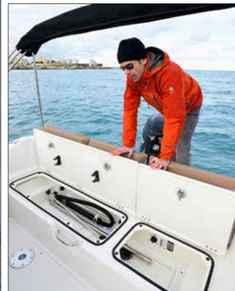
Sous les banquettes arrière se trouvent des rangements pour les pieds de table et les feux de navigation.