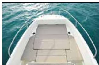
Sur les deux Open, le solarium avant est vraiment optimisé (1,86 x 1,64 m).