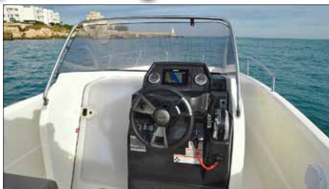
Le pare-brise est davantage teinté qu'auparavant. La planche de bord est peut-être un peu petite pour qui veut installer un grand lecteur de carte.

C'est le bloc de 3 litres Mercury de 150 chevaux EFI qui propulsait cette coque d'un peu plus d'une tonne. Le déjaugage s'effectue en à peine plus de 4 secondes, ce qui est correct, et la vitesse maximale est proche de 35 nœuds, que demander de plus ? La coque donne malgré tout une sensation de lourdeur, surtout lors des retombées dans la vague. D'après les données du chantier, notre 675 Open atteint 37,1 nœuds avec 175 chevaux, et 39,2 nœuds avec un 200 chevaux Verado ; il serait intéressant de le tester avec ces motorisations. ■