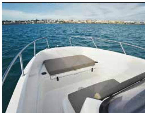
Le solarium se déploie rapidement, mais il faut ajouter les deux extensions latérales pour qu'il soit complet (1,77 x 1,94 m).