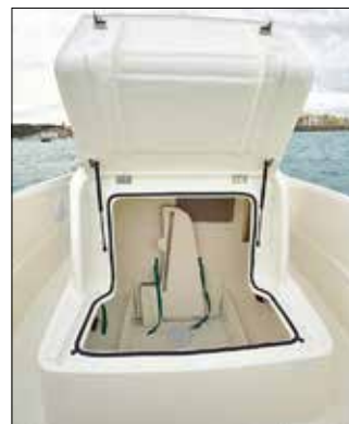
Dans la console, table et autres accessoires sont maintenus par des sangles.