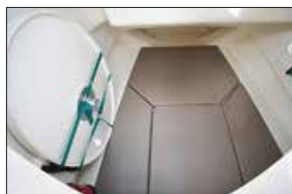
Le couchage convient aux petits enfants (1,56 m maxi sur 1,35 m).