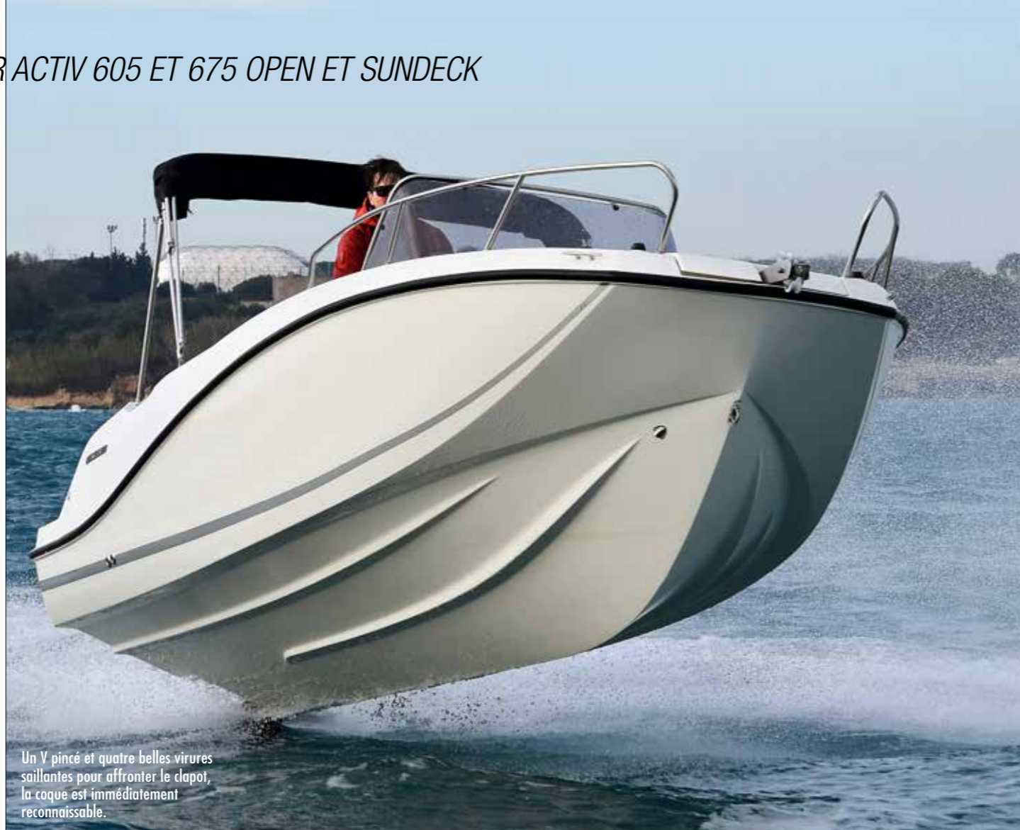
Un V pincé et quatre belles virures saillantes pour affronter le clapot, la coque est immédiatement reconnaissable.

La nouvelle génération Sealine produite en Allemagne applique