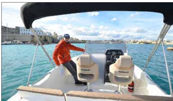
Le bimini mériterait d'être haubané avec des sangles (comme sur les Boston Whaler) pour éviter qu'il oscille trop en navigation dans le clapot.