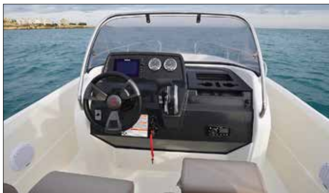
La planche de bord est bien organisée, la commande pupitre a son emplacement dédié et le volant est parfait. Les petits rangements sur le côté sont aussi agréables.

Le chantier annonce alors 2 nœuds de mieux en vitesse de pointe. Avec le 150 chevaux EFI, une puissance probablement excessive, l'Activ atteint 39 nœuds. Cette carène a déjà fait ses preuves, elle est à l'aise dans les vagues, saine en virage et facile à piloter. La surface un peu plane du haut de la proue est probablement moins efficace pour défléchir les embruns qu'une étrave bien tulipée, remarque qui vaut pour les quatre Activ testés. Le moteur était-il un peu haut ? Toujours est-il qu'il ventilait en virage serré, aussi bien sur bâbord que sur tribord. La modularité du salon avant et l'intelligence des rangements sont plaisantes sur ce petit open. ■