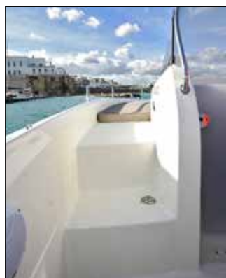
Bien costaud, le passavant mesure près d'un demi-mètre de large.