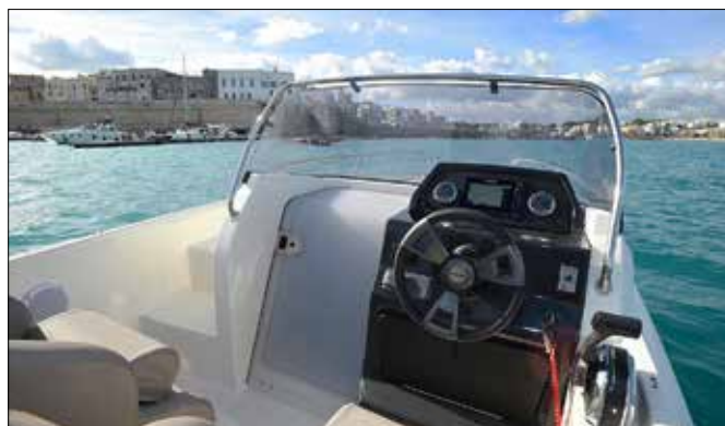
Le poste de commande est décalé sur tribord, libérant un accès pour la cabine. La commande pupitre est bien placée, jouxtant le plat-bord.

Le 150 chevaux EFI est l'option la plus sportive, et le bateau déjauge en un peu moins de 4 secondes. Le bon compromis serait sans doute le 115 chevaux en version CT (embase forte poussée), ce qui permet déjà d'accrocher 34 nœuds d'après Quicksilver. Le 605 Sundeck offre une belle cabine dans laquelle deux adultes peuvent dormir à l'aise. Le principe de la console décalée permet de libérer un grand passavant de 0,45 mètre de large sur bâbord. ■