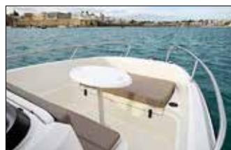
Carré ou bain de soleil, la modularité facile du salon avant est plaisante.