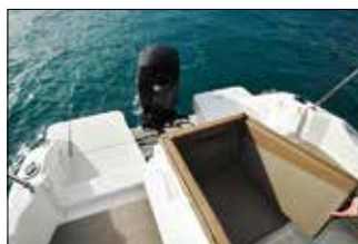
Il est possible d'entrer ou de sortir des deux côtés grâce au double portillon.