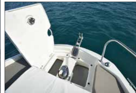
Le guindeau disparaît sous un solide capot en polyester. Le davier intègre deux rouleaux pour guider la chaîne.