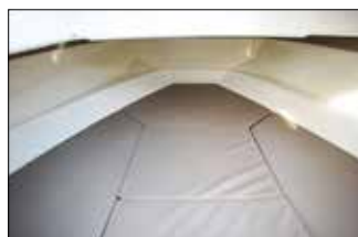
Dans la cabine contre-moulée, la surface du couchage est de 2,14 m par 1,87 m !